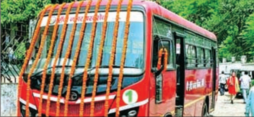
चयन के लिए निविदा प्रक्रिया का कार्य रांची नगर निगम द्वारा खुली एवं प्रतिस्पर्धी ई-निविदा प्रक्रिया अपना कर किया जायेगा। इस कार्ययोजना में प्रत्येक वित्तीय वर्ष होने वाले वास्तविक वित्तीय घाटे का वहन नगर विकास एवं आवास विभाग द्वारा राज्य योजना शहरी जलापूर्ति,

रांची: राजधानी रांची में 244 नये सिटी बस का संचालन पीपीपी मोड पर करने के लिए जल्द ही निविदा निकाली जायेगी। मंत्रपरिषद के फैसले के बाद नगर विकास विभाग ने रांची नगर निगम को इसकी जिम्मेदारी दी है कि वे सिटी बस परिचालन के लिए आवश्यक कार्रवाई प्रारंभ करें। ऐसे में अब रांची नगर निगम द्वारा उक्त योजना के क्रियान्वयन के लिए अतिक्रमण मुक्त भूमि, परियोजना स्थल की उपलब्धता सुनिश्चित करने के लिए कार्रवाई की जायेगी। निगम परियोजना के क्रियान्वयन के लिए बोर्ड का अनुमोदन लेगा एवं मंजूरी प्रदान करने के बाद निजी भागीदार को सुविधा उपलब्ध करायेगा। इस योजना कार्यान्वयन ऑपरटर 1 एवं ऑपरटर 2 के