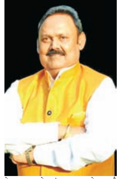
पेयजल का घोर संकट उत्पन्न हो गया है