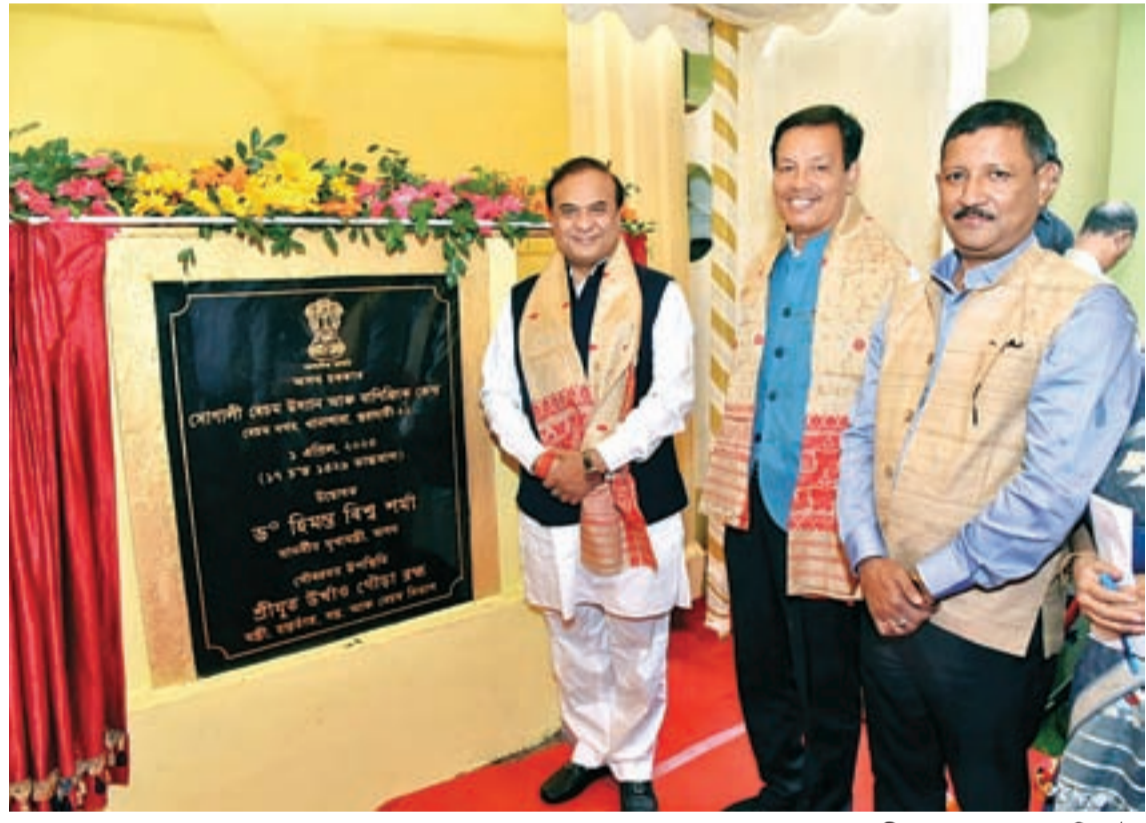
প্রসঙ্গত শনিবার গুয়াহাটী মহানগরের খানাপাড়া মোহালী রেশম উদ্যান এবং বাণিজ্য কেন্দ্রর আনুষ্ঠানিকভাবে শুভ

উদ্যোগীদের মধ্যে এক উৎসবমুখর পরিবেশে সৃষ্টি হয়েছে। রাজ্য সরকার শুরু করা স্বনির্ভর নারী প্রকল্পের মাধ্যমে সর্বপ্রথম বার সিপিনিরা উৎপাদন করা গামছা উচিত দামে ক্রয় করে সাধারণ মানুষের মধ্যে বিক্রি করার মাধ্যম হিসেবে আর্থফেডকে গড়ে তোলা হয়েছে বলে মন্তব্য করেছেন তিনি। মুখ্যমন্ত্রী ড০ হিমন্ত বিশ্ব শর্মা বলেন ইতিমধ্যে রাজ্যের সিপিনিদের থেকে আর্টফ্যাড দেড় লক্ষ গামছা ক্রয় করেছে। তিনি বলেন হস্ততাতে, বস্ত্র এবং রেশম বিভাগের এই পদক্ষেপের জন্য কোন ব্যক্তি বা প্রতিষ্ঠান সিপিনিদের থেকে গামছা কিনে প্রাপ্য মূল্য দিতে বাধ্য হয়েছে। স্বনির্ভর প্রকল্পটির ব্যাপক প্রচার করার জন্য মুখ্যমন্ত্রী বিভাগের প্রতি আহ্বান জানিয়েছেন। তিনি বলেন আন্তর্জাতিক বাজারে স্থান লাভ করার জন্য মুগা এরি ইত্যাদি সূতার মাধ্যমে নির্মিত বিভিন্ন সামগ্রী প্রস্তুত করার প্রয়োজনীয়তা রয়েছে। যখন পর্যন্ত এই ধরনের সূতার মাধ্যমে নানা সামগ্রী উৎপাদন করা যাবে না ততদিন রাজ্যের সিপিনিরা উপযুক্ত বাজার পাওয়ার ক্ষেত্রে বঞ্চিত হয়ে থাকবেন বলে মন্তব্য করেন তিনি। মুখ্যমন্ত্রী বলেছেন দেশের বাইরে মুগার যথেষ্ট জনপ্রিয়তা রয়েছে। ফলে দেশের বস্ত্র উদ্যোগের সঙ্গে জড়িত ডিজাইনদের সঙ্গে মিলিত হয়ে এই ধরনের সূতা প্রস্তুত করা বিভিন্ন সামগ্রীর মডেল বানিয়ে রাজ্যের সিপিনিদের পরিচয় করিয়ে দেওয়ার জন্য বিভাগের প্রতি আহ্বান জানিয়েছেন তিনি।