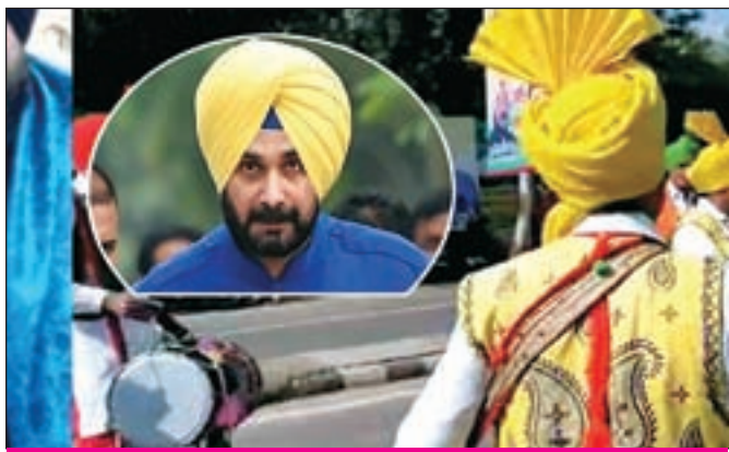
जेल से बाहर निकलते ही सिद्धू ने सरकार पर हमला बोला

चंडीगढ़: पूर्व अंतर्राष्ट्रीय क्रिकेटर और कांग्रेस नेता नवजोत सिंह सिद्धू आज पटियाला जेल से बाहर निकले। उनके बाहर निकलने की खबर कल ही सार्वजनिक हो गयी थी। इसमें कहा गया था कि आज सुबह के दस बजे के बाद वह जेल से बाहर आयेगे। इसी सूचना पर जेल के बाहर सुबह से ही उनके समर्थकों की भारी भीड़ एकत्रित हो गयी थी। लेकिन वह शाम को छह बजे के बाद बाहर निकले। बता दें कि सड़क पर हुई मारपीट और एक व्यक्ति की मौत के मामले में सुप्रीम कोर्ट ने पिछले साल 19 मई को सिद्धू को एक साल की सजा सुनाई थी। कांग्रेस नेता सिद्धू ने पटियाला जेल से निकलते ही मीडिया से बात