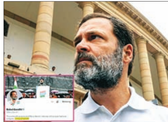
अवा मुरलीधरन ने अदालत का दरवाजा खटखटाया है

नईदिल्ली: राहुल गांधी भी अब आपदा में अवसर तलाशना सीख गये हैं। इसलिए आनन फानन में उनकी लोकसभा सदस्यता रद्द होने को भी उन्होंने अपना राजनीतिक हथियार बना लिया है। उन्होंने अपने ट्विटर एकाउंट पर खुद को डिसक्वालिफायेड एमपी यानी अयोग्य घोषित सांसद लिख दिया है। उन्होंने ट्विटर हैंडल पर अपनी पहचान बदल ली। उन्होंने अपने ट्विटर हैंडल से हटाने को एक राजनीतिक उपकरण के रूप में इस्तेमाल किया। रविवार सुबह से ही राहुल के ट्विटर एकाउंट पर उनकी तस्वीर के नीचे अयोग्य घोषित सांसद लिखा पाया गया। सोशल मीडिया में यह तेजी से वायरल