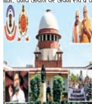
कठिन होती चली जा रही हैं। दरअसल इससे पहले ऐसी अपर्याप्त चुनौतियों की कल्पना नहीं की गयी थी।

माहौल तो किसान आंदोलन के समय से ही बदलना प्रारंभ हो गया था। उसके बाद राहुल गांधी की भारत जोड़ो यात्रा में देश को नये तरीके से सोचने का एक विकल्प दिया। हिंडनबर्ग की रिपोर्ट और उस पर राहुल गांधी के सवालों ने जो बवंडर पैदा किया, वह अब तक मौजूद है। इसमें आम जनता के लिए जो सबसे प्रासंगिक सवाल हैं, वह यह हैं कि आखिर अडाणी समूह को इतना अधिक लाभ श्री मोदी के कार्यकाल में कैसे हुआ।