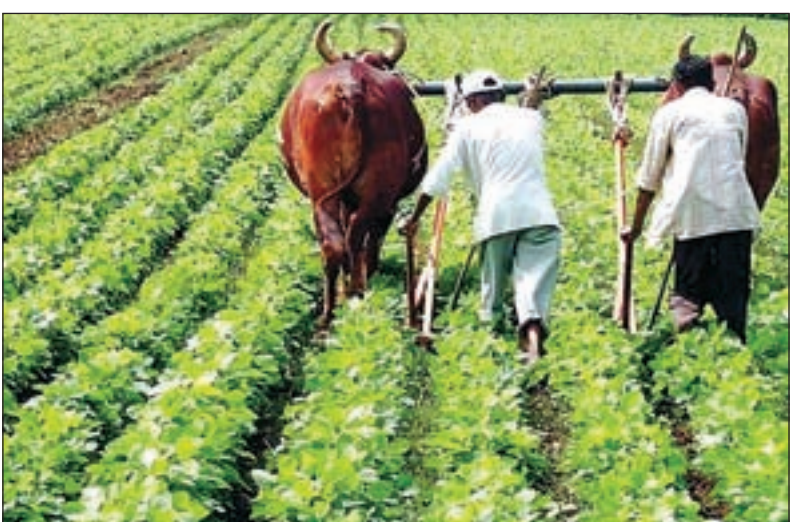
दरअसल समझना यह होगा कि कृषि आदान के रूप में उपलब्ध कराई जाने वाली सामग्री चाहे वह बीज के मिनीकिट हो या उर्वरक या फिर कीटनाशक या अन्य कुछ उसका सीधे सीधे और शतप्रतिशत उपयोग खेती किसानों में ही होगा। काशतकार बीज को बुवाई के ही काम में लेगा और इससे उत्पादन बढ़ेगा जिससे काशतकार के साथ ही प्रदेश व देश को लाभ मिलेगा। देश और प्रदेश में कृषि उत्पादन बढ़ेगा। इससे दोहरा लाभ सुनिश्चित है। एक तो यह कि काशतकारों को बुवाई के समय बीज की गुणवत्ता और प्रमाणिकता से समझौता नहीं होगा और किसान नकली बीज से टगा नहीं जाएगा। इसके साथ ही यह भी साफ़ होगा कि चूँकि सरकार द्वारा बीज के मिनी किट का वितरण किया जाएगा तो निश्चित रूप से यह भी सुनिश्चित होगा कि क्षेत्र विशेष के लिए उपयुक्त किस्म के बीज काशतकारों को मिल सकेंगे। इससे बीज की गुणवत्ता पर भी किसी तरह का संदेह नहीं किया जा सकेगा।

यदि खेती किसानों से काशतकारों की माली हालत सुधारनी है तो काशतकारों को कृषि आदान के रूप में सहायता दी जानी होगी। इसके लिए सरकारें द्वारा चाहे केन्द्र की हो या प्रदेशों की, जितनी राशि का अनुदान प्रावधान किया जाता है या ऋण माफ़ी की अनुमानित राशि का प्रावधान किया जाता है उतनी राशि से काशतकारों को कृषि आदान यानी कि उन्नत बीज-खाद, कीटनापक आदि के मिनी किट के रूप में निःशुल्क या अनुदानित दर पर सीधे काशतकार को उपलब्ध कराया जाता है तो इसका वास्तविक लाभ खेती किसानों को मिल सकेगा। हालिया राजस्थान सरकार के आगामी वर्ष के हालिया बजट को इस दिशा में सकारात्मक पहल माना जा सकता है।