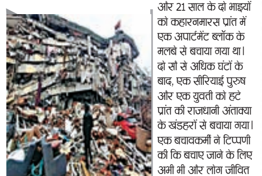
संयुक्त राष्ट्र के अधिकारियों का कहना है कि बचाव का चरण समाप्त हो रहा है, अब ध्यान जीवित बचे लोगों के लिए आश्रय, भोजन और स्कूल प्रदान करने पर केंद्रित है।

तुर्की और सीरिया के भूकंप में अब तक 41 हजार से अधिक लोगों की मौत हो चुकी है। 6 फरवरी की सुबह से पहले दक्षिणी तुर्की शहर गज़ियांटेप के पास 7.8 की तीव्रता वाले भूकंप में दोनों देशों के शहरों को बर्बाद कर दिया, जिससे लाखों लोग घायल हो गए और कई बचे लोग कड़ाके की ठंड में बेघर हो गए। तुर्की के राष्ट्रपति रेंसेप तईप एर्दोगन ने स्वीकार किया कि भूकंप के बाद शुरूआती प्रतिक्रिया के दौरान कुछ समस्याएं थीं, लेकिन उन्होंने दावा किया कि स्थिति अब नियंत्रण में है। राजधानी अंकारा से राष्ट्र के नाम एक संबोधन में, एर्दोगन ने कहा, हम न केवल अपने देश, बल्कि मानव जाति के इतिहास की सबसे बड़ी प्राकृतिक आपदाओं में से एक से निपट रहे हैं। रॉयटर्स की रिपोर्ट के मुताबिक, सीरिया में मरने वालों की संख्या 5,814 है। भूकंप के एक सप्ताह से अधिक समय बाद मंगलवार को बचावकर्मियों ने तुर्की में इमारतों के मलबे से नौ लोगों को ज़िंदा निकाला। उनमें से 17