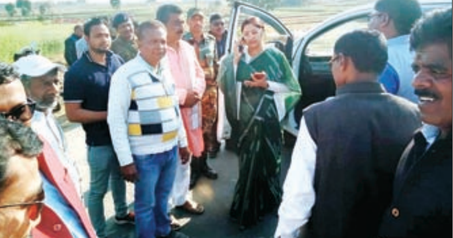
मेटल की जगह ज्यादा डस्ट का ही उपयोग के साथ-साथ रोलिंग भी कम किया जा रहा है, डस्ट धूल से आने जाने वाले ग्रामीणों हैं परेशान पानी छिड़काव की है जरूरत, अमर सुधार नहीं किया गया तो सड़क बनते ही अति शीघ्र खराब हो जाएगी। इसके बाद पहले से और बदतर