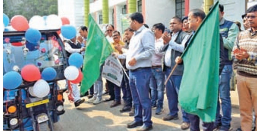
द्वारा संयुक्त रूप से हरी झंडी दिखाकर रथ को रवाना किया गया। उपायुक्त ने कहा कि यह चलंत रथ जिले के सभी प्रखण्ड अन्तर्गत आने वाले पंचायतों, हाट बजारों, शहरी क्षेत्रों में घुम घुमकर

► सोशल मीडिया के माध्यम से भी किया जाएगा व्यापक प्रचार प्रसार ► सोशल मीडिया के द्वारा भी प्रचार प्रसार को दिया जा रहा है बढ़ावा